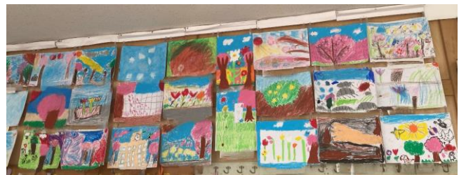
廊下に展示された2年生の図工作品 と 学年集会の様子